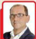
di Alberto Pellai medico, psicoterapeuta

I padri non possono più usare il codice del silenzio con i loro figli maschi. Le mamme devono aiutare le figlie a comprendere che il loro valore non dipende dall'apparire sexy e disponibili. Oggi questa ai più sembra una missione impossibile. Musica, serie tv, influencer raccontano una sessualità disinibita, non intimidante ma solo eccitante, dove cercare il piacere viene prima dell'incontro profondo con l'altro. L'educazione affettiva e sessuale dei preadolescenti non è solo un dovere degli adulti, ma un diritto e una necessità assoluta per i ragazzi, cui anche la scuola, dopo l'emendamento che esclude il tema dalle aule delle medie, rischia di abdicare.